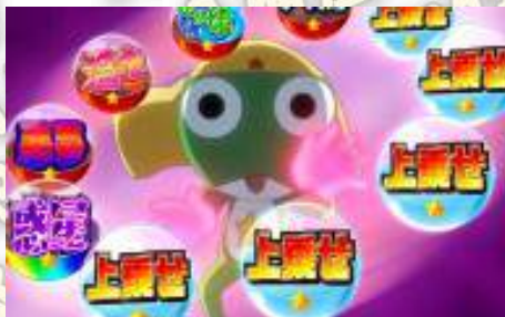
キンキンケロン波