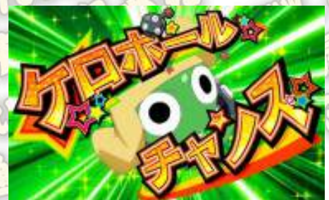
ケロボールチャンス (K隆球機會)