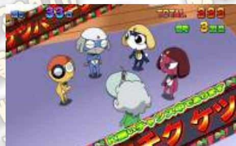
ケツバクチクモード