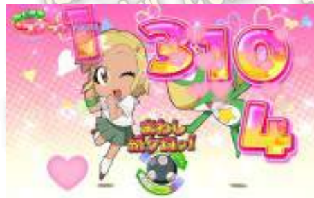
大叔 LOVE 機會