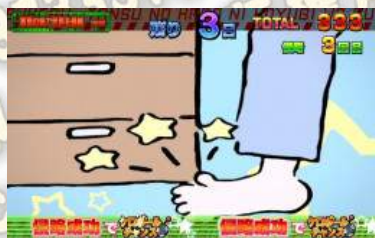
櫃子角落侵略作戰