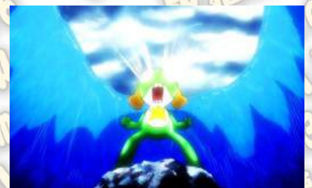
あの頃モード (無敵化模式)