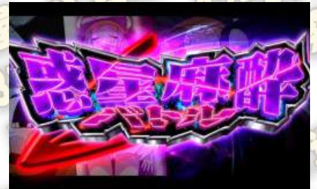
惑星麻醉バトル(戰鬥)

惑星麻醉バトル(戰鬥)是内部的點數累積到一定數值有突入的可能性，液晶上雜訊演出是暗示點數獲得。